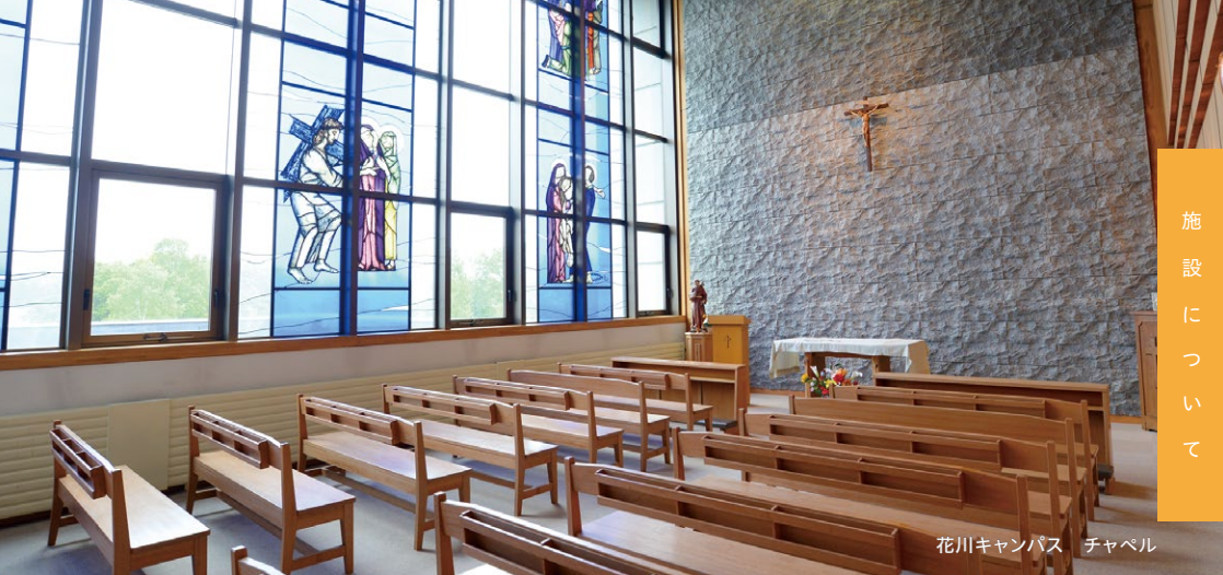
花川キャンパス チャペル