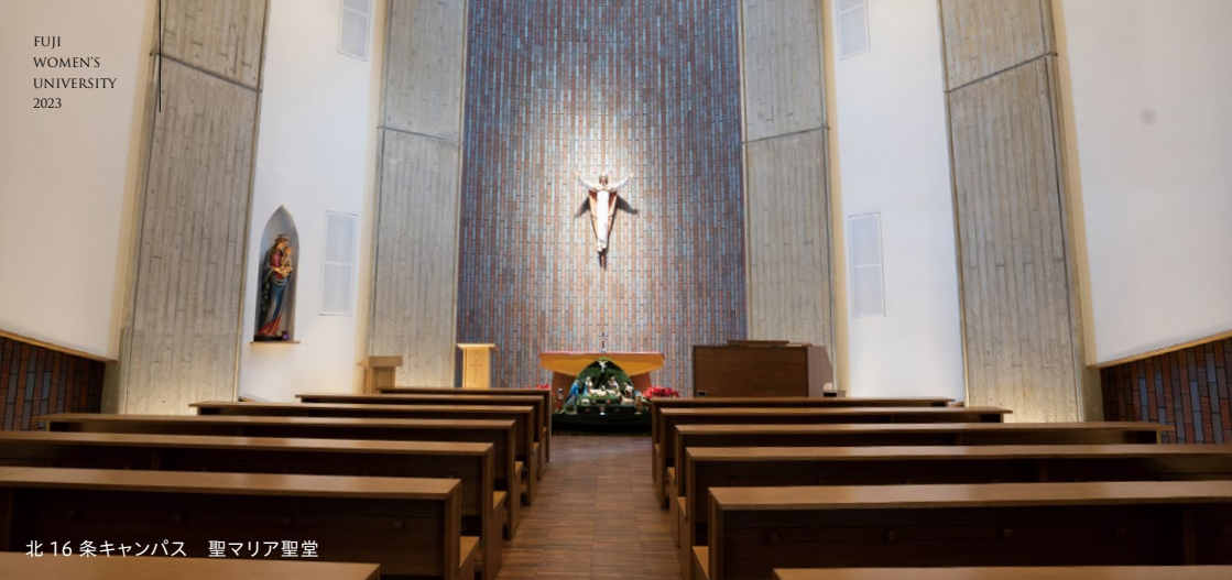
北16条キャンパス 聖マリア聖堂