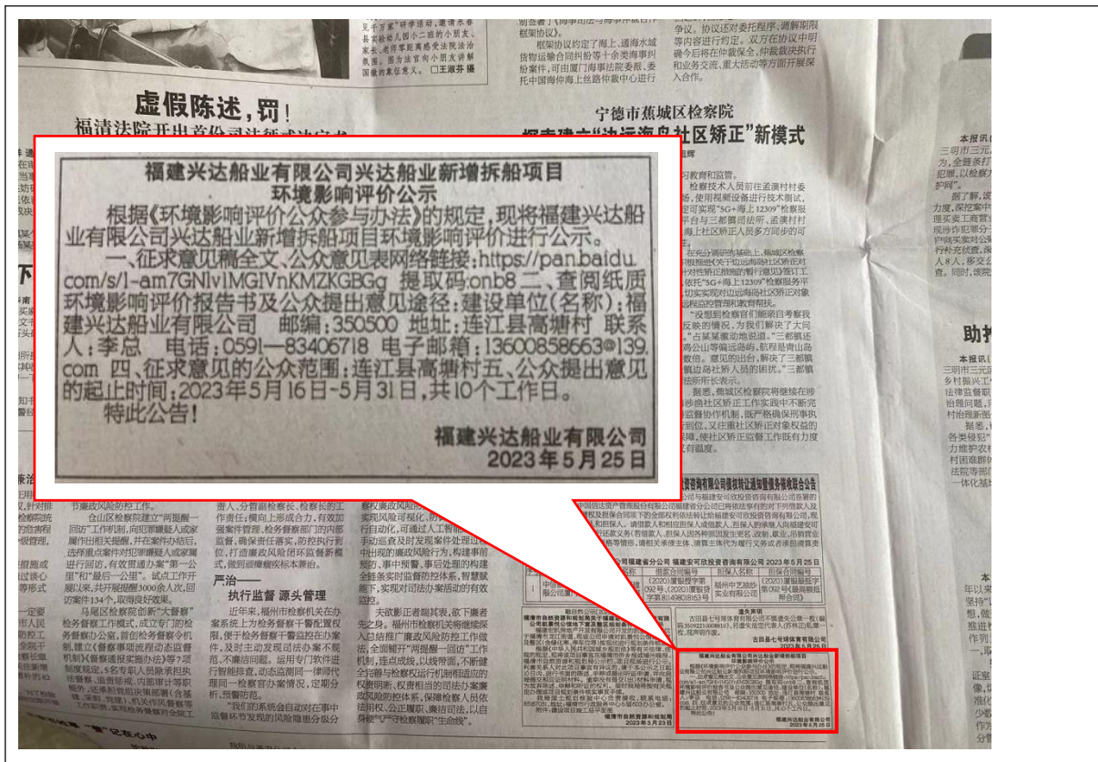
图4 征求意见稿公示截图