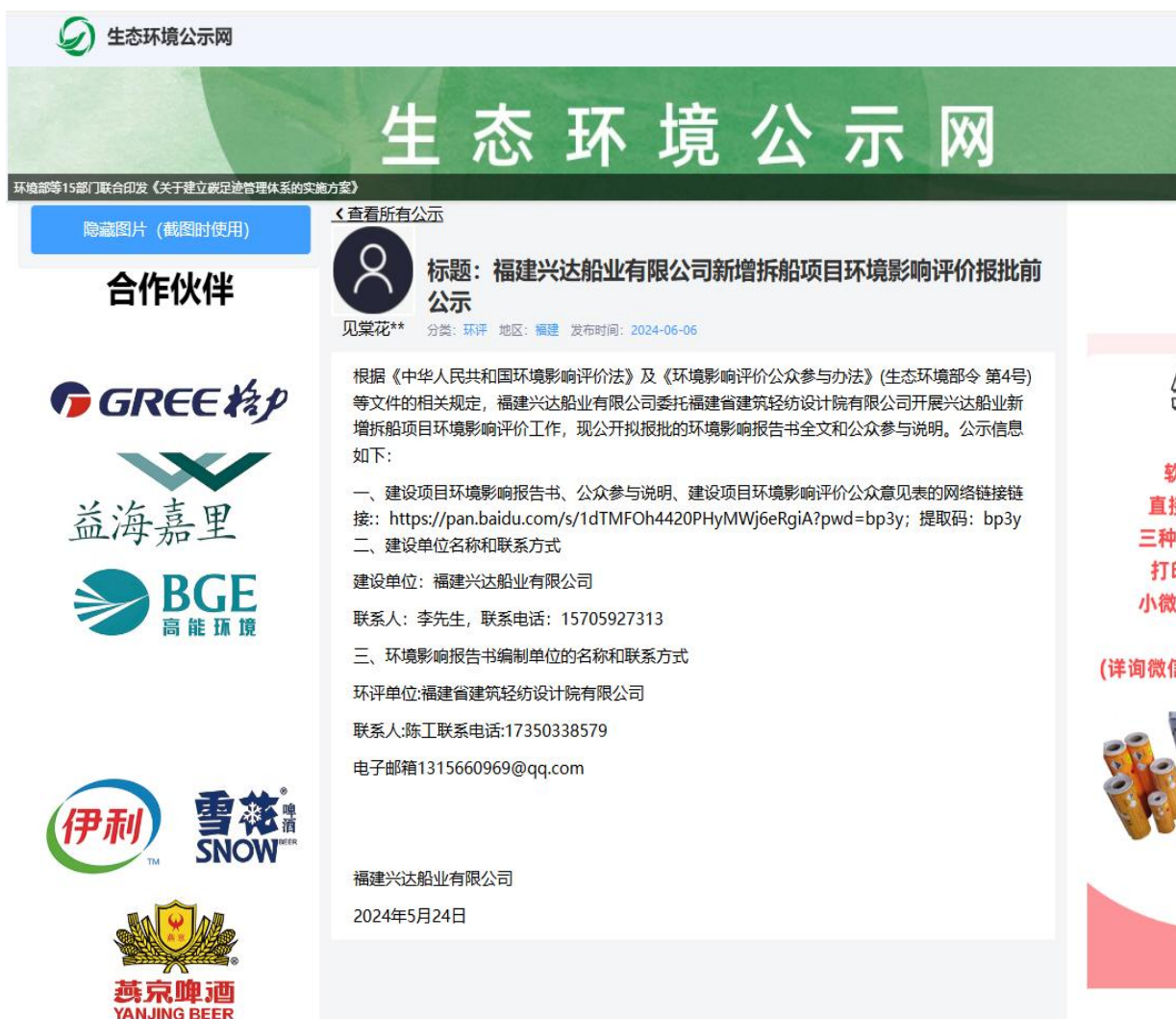
图6 报批前公示截图