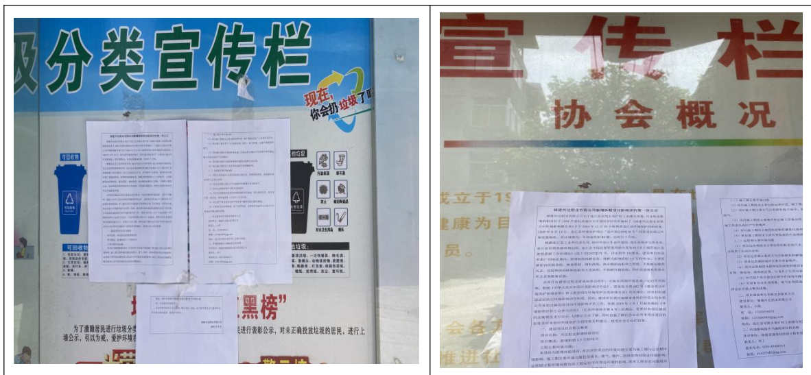
图2 周边村庄第一次公示情况