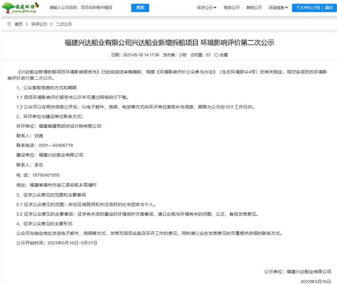
图3 征求意见稿第二次公示截图